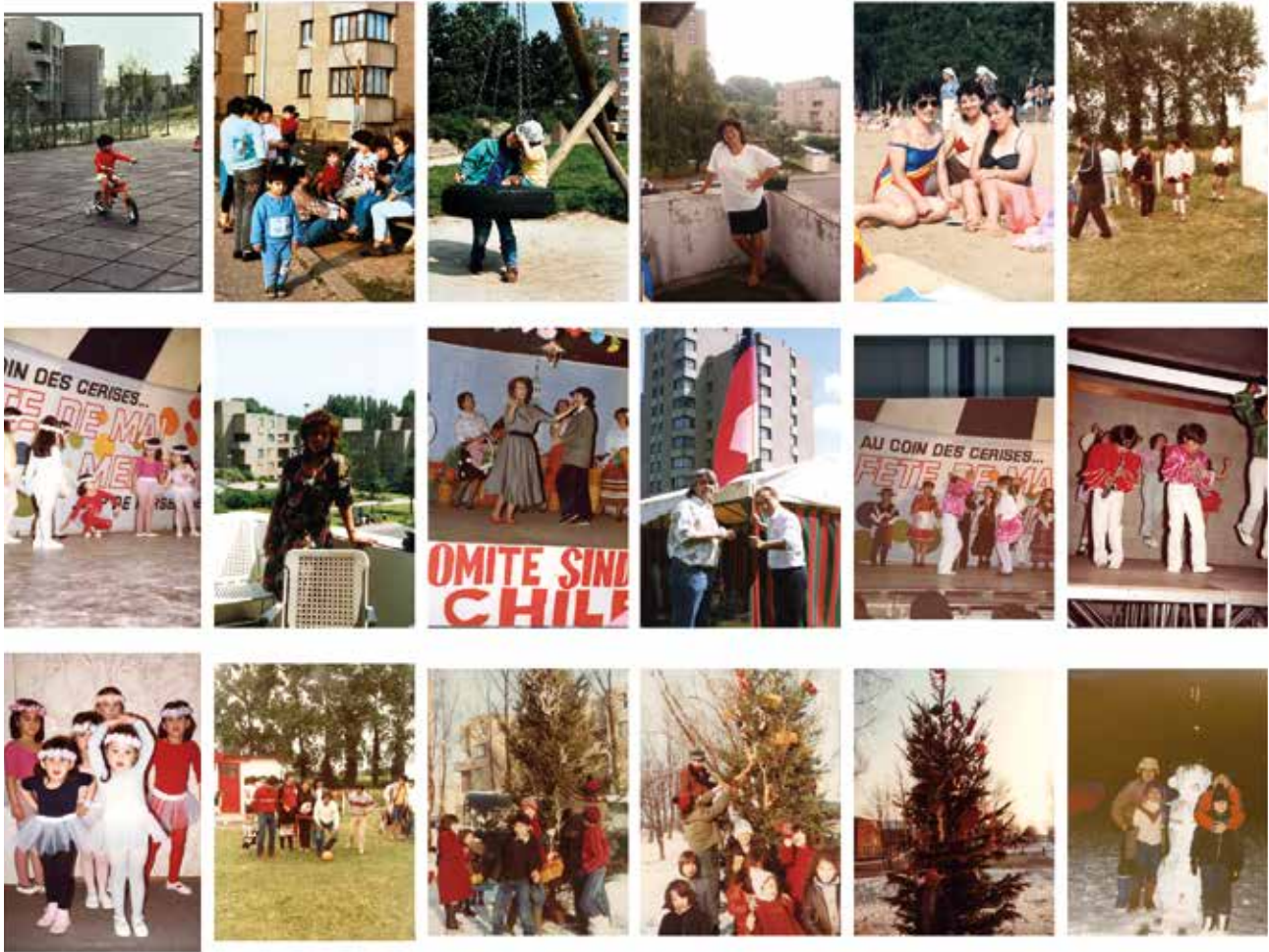
Photos des albums de familles de Chile Chico du quartier Versailles, dans les années 1970.

familles chiliennes et aux habitants et habitantes du quartier des années 1970 à aujourd'hui. Ce projet a été le pilote d'une vaste exploration sur les mémoires latino américaines sur le territoire bruxellois. Une archive collaborative en ligne intitulée Mi Barrio Bruxelles se concentre sur la cartographie des lieux communs et des récits d'exil à Bruxelles. Cette autre expérience, actuellement en développement, a l'ambition de devenir une plateforme de référence pour et par les Latinos-américains vivant à Bruxelles.